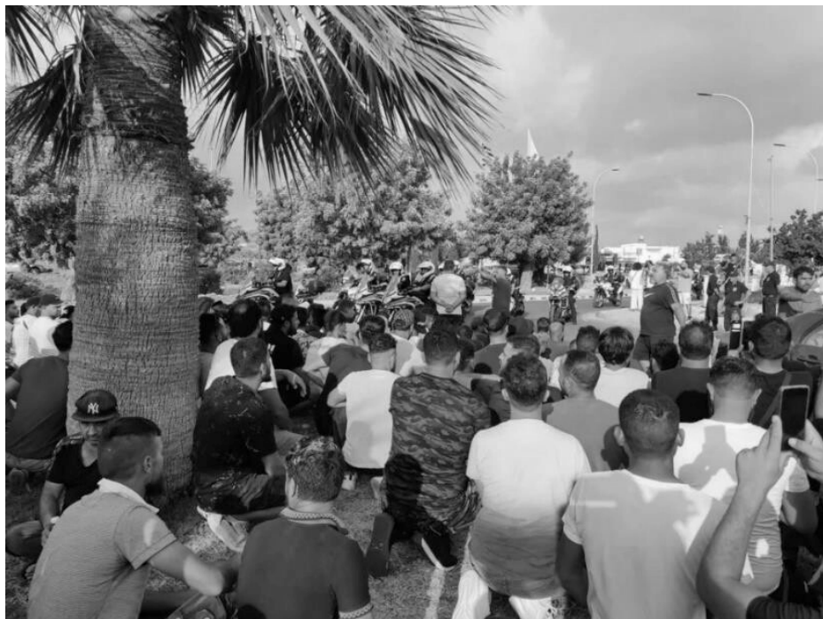
Συγκέντρωση διαμαρτυρίας Σύριων κατοίκων στην Χλώρακα την επόμενη μέρα του πογκρόμ

Στον απόηχο του πογκρόμ στη Χλώρακα, όλα τα κόμματα και οι δημόσιοι φορείς καταδίκασαν τα «επεισόδια» και επανέλαβαν τις θέσεις τους για το μεταναστευτικό ως μοχλό πίεσης στην κυβέρνηση. Η αστυνομία ενισχύθηκε ακόμα παραπάνω και η κυβέρνηση έστειλε την υπουργό δικαιοσύνης και τον αρχηγό της αστυνομίας να μιλήσει με την Συριακή κοινότητα.